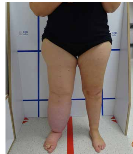
Lymphoedème unilatéral primaire membre inférieur droit