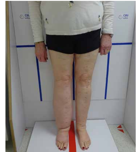
Photo standard membre inférieur