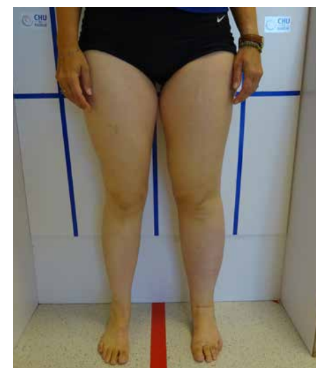
Lymphoedème secondaire unilatéral membre inférieur gauche