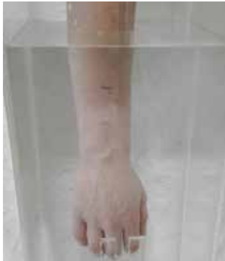
Volumétrie aqueuse numérisée dérivée du principe d'Archimède : main et poignet – pied et cheville