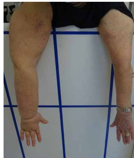
Lymphoedème unilatéral primaire membre supérieur droit

Le lymphoedème représente donc un problème invalidant nécessitant un traitement approprié.