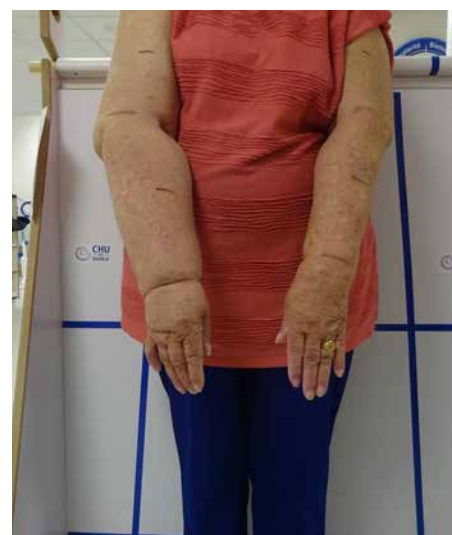
Lymphoedème secondaire unilatéral membre supérieur droit