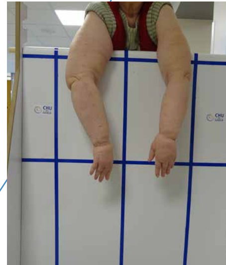
Photo standard membre supérieur