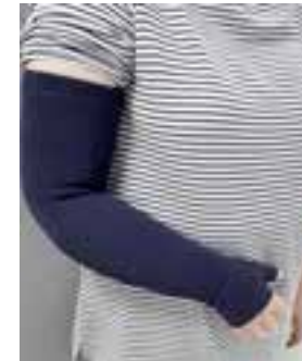
Modèles de contention pour les membres supérieurs et inférieurs

Vous trouverez des vidéos expliquant les aides à la pose de votre bas de compression sur notre chaîne youtube ( youtube.chuclnamur.be ) ainsi que des fiches explicatives sur notre site web ( chuclnamur.be/services/centre-de-referance-du-lymphoedeme ).